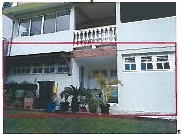
Façade avant de l'immeuble et entrée vers logement au R-2